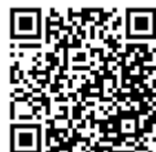
空メールアドレス (QRコード)

その後、表示された「空メール送信」画面で「メールを送信する」をクリックし、空メールを送ってください。